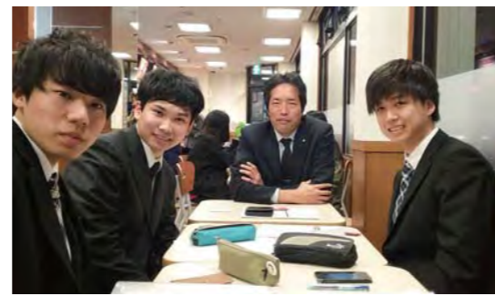
2017年インターン（福山大学）未来自治体コンテストの政策提案を検討中