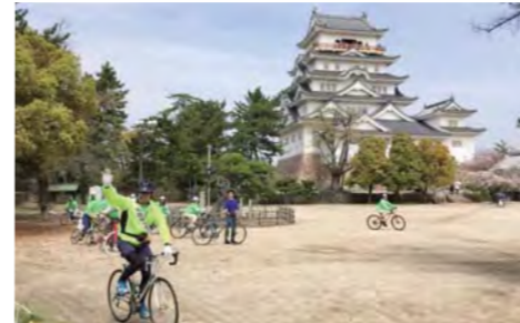
福山城の数々の活性化策を提案!