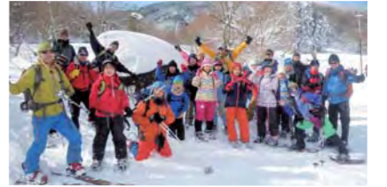
山岳会の子供たちは雪山だって登ります