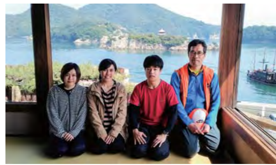
2019年インターン（広島大学・福山市立大学）鞆のまちづくりの課題について現地視察