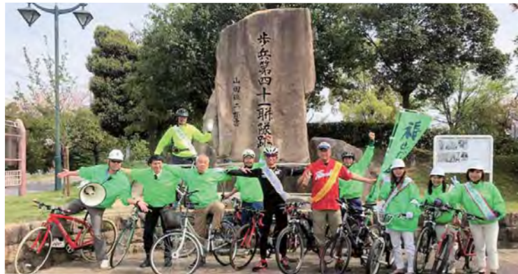
私が移設した「歩兵第四十一連隊跡」記念碑前にて