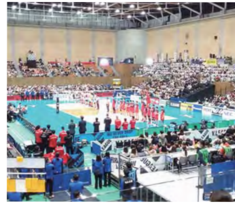
エフピコアリーナふくやま内部