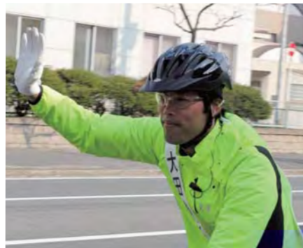
選挙中は自転車で街宣活動!