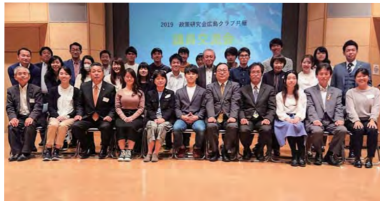
NPO 法人ドットジェイピーの大学生と議員の交流会