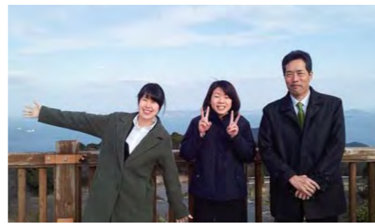
2018年インターン（島根県立大学）グリーンライン二輪通行止めの現地視察