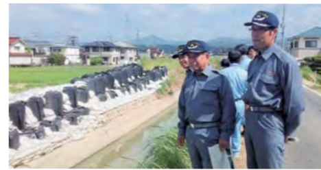
豪雨災害被災地の現地視察