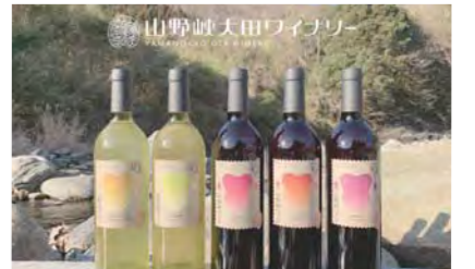
ワイナリーのホームページもできました