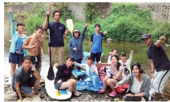
2016年インターン（福山市立大学・比治山大学）中学生たちと山野峡で自然体験、ぶどう収穫も体験