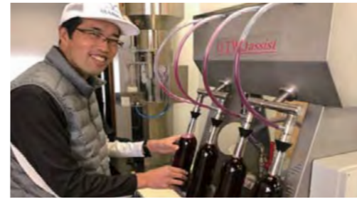
福山の新たな名産「山野峡ワイン」を充填中!