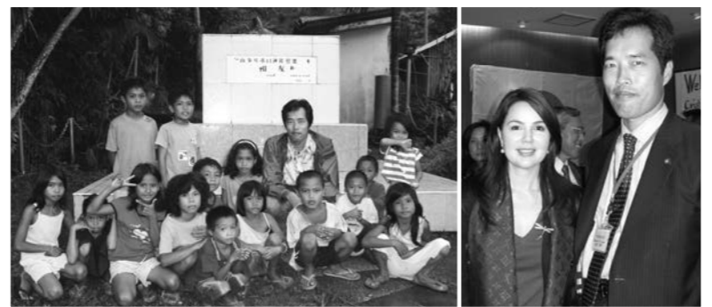
レイテ島の41連隊慰霊碑