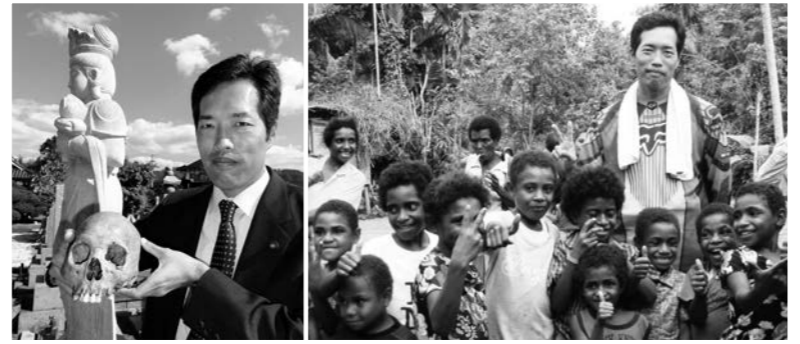
ニューギニアから帰還したご遺骨