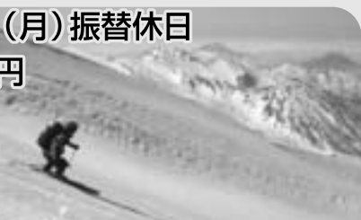
白馬岳で山スキー